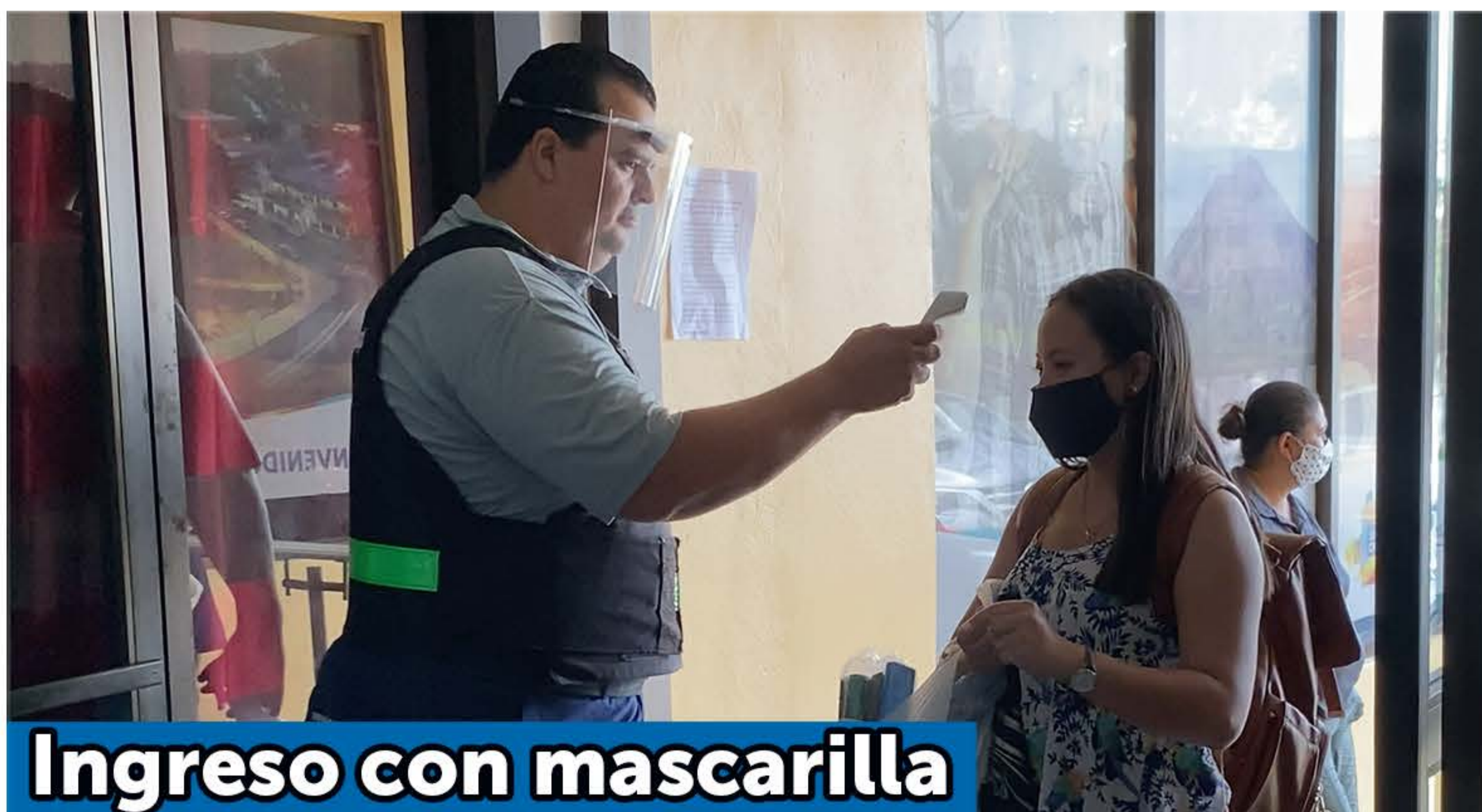
Ingreso con mascarilla