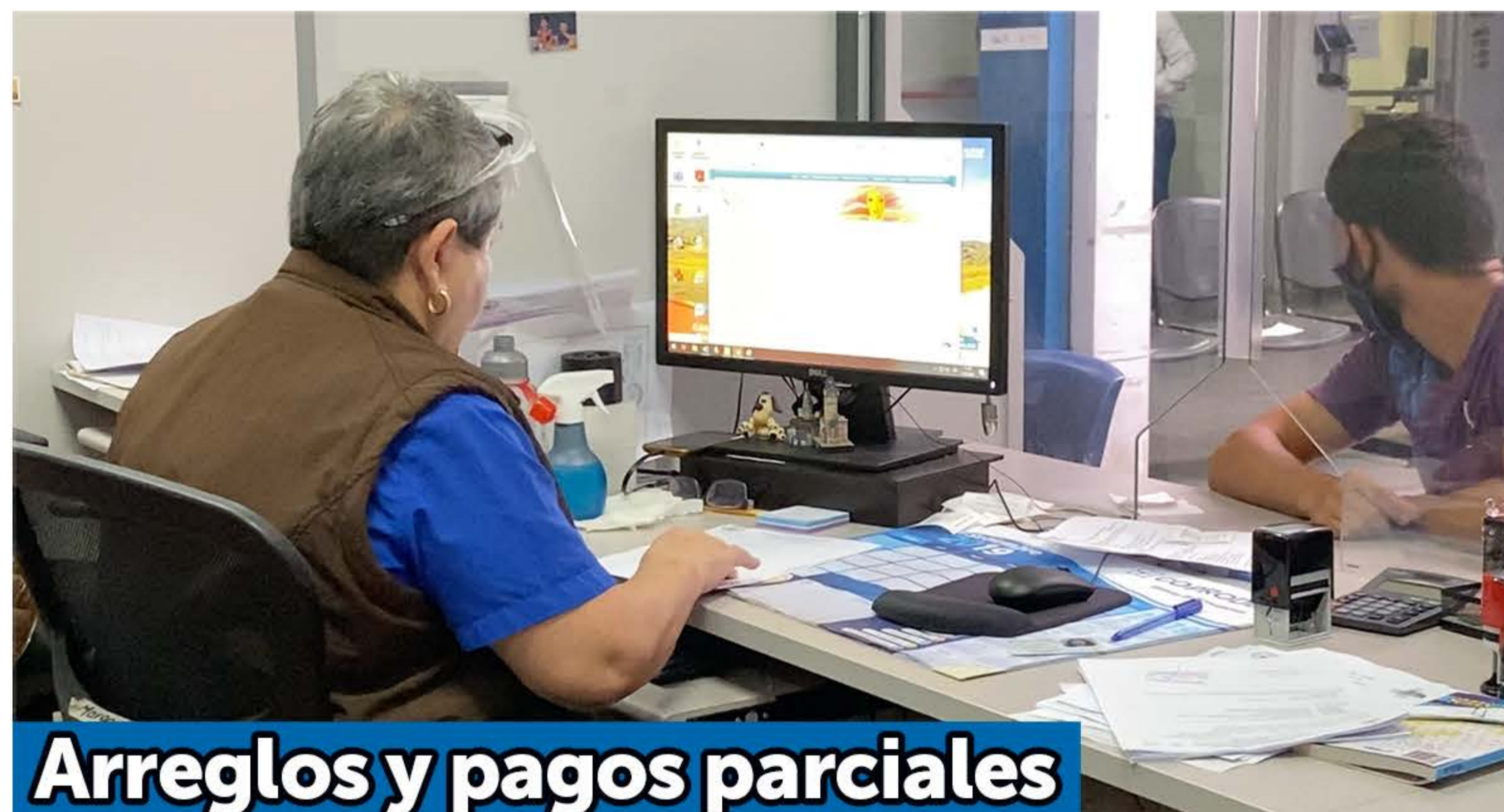
Arreglos y pagos parciales