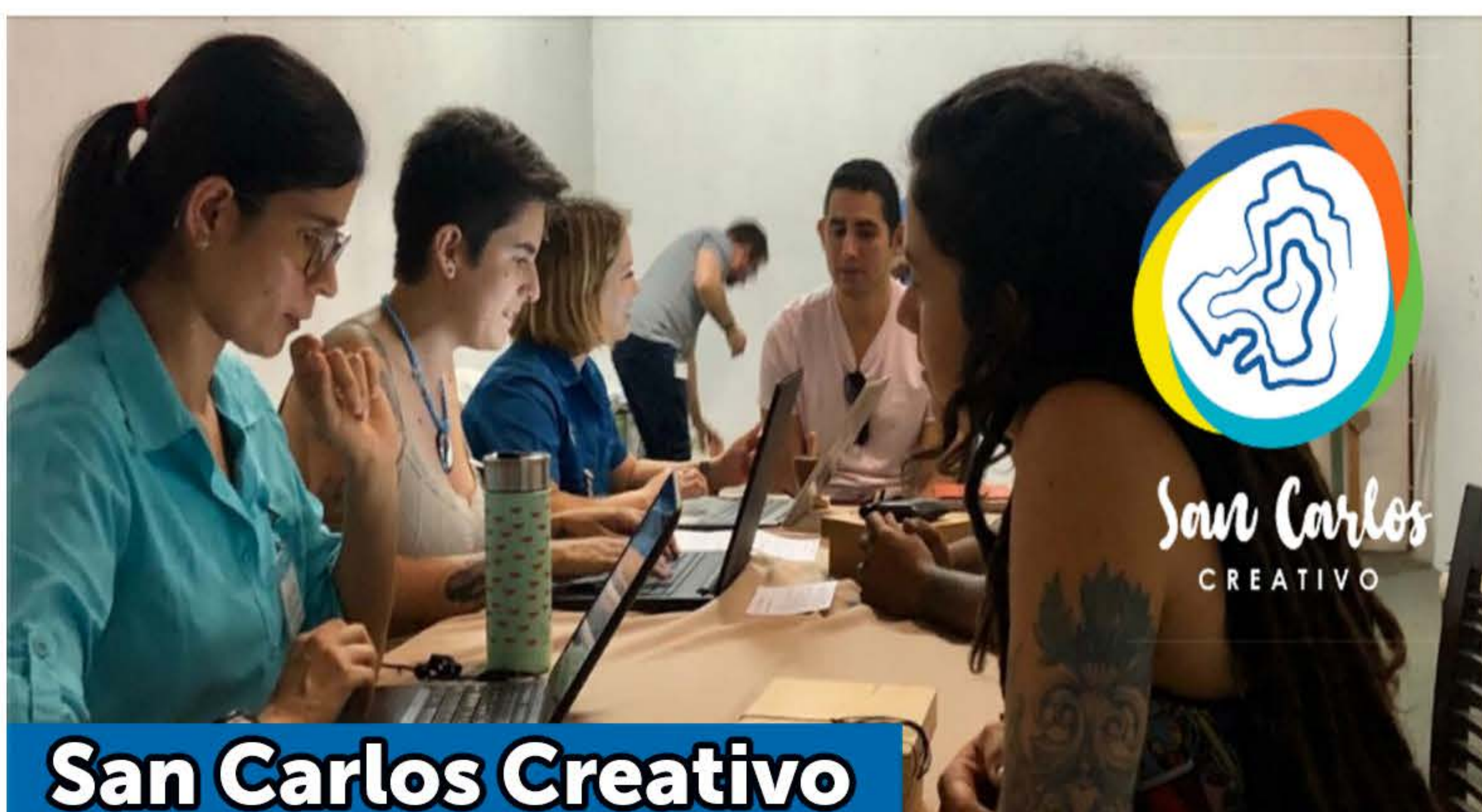
San Carlos Creativo